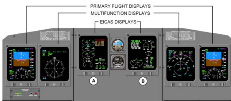
図 1 : 【計器板全体図】