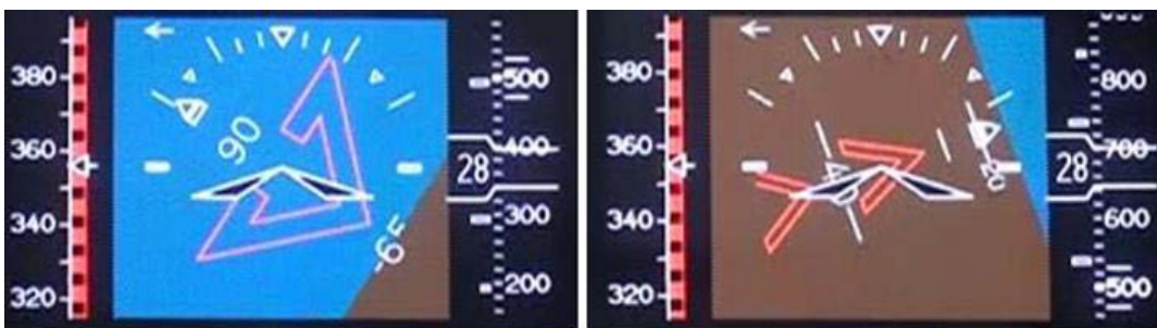
図 3 : 【T22 での左右 PFD 表示】