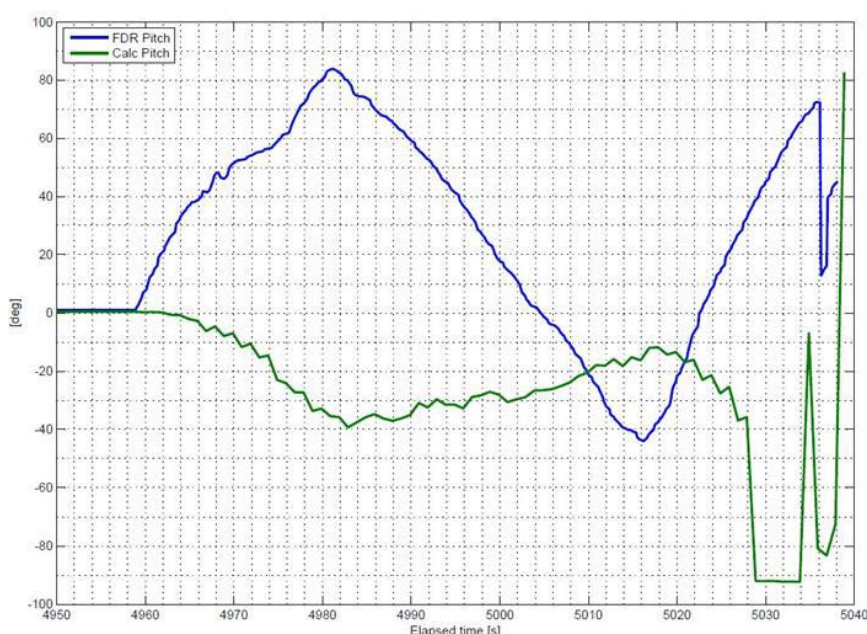
図 5 : 【FDR 解析値】

下図は FDR に記録された数値を表にしたものです。左 PFD ピッチ角：青色、TAS/Longitudinal Acceleration 記録より算出した実ピッチ角：緑色で表示しています。左 PFD は最大で 83 度機首上げとなっていますが、その直後に実ピッチ角は 40 度機首下げとなっているのが判ります。