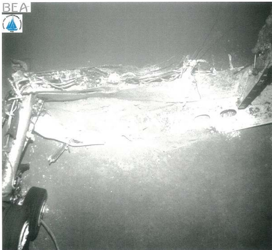
Photo - train d'atterrissage/landing gear